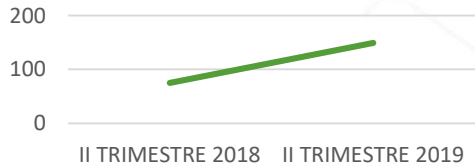
Comparativo de encuestas registradas en trimestres anteriores

El resultado del seguimiento de satisfacción del cliente presenta una tendencia positiva, sin embargo se esta trabajando para alcanzar un 98% en excelencia y así tener ciudadanos satisfechos con los servicios prestados.