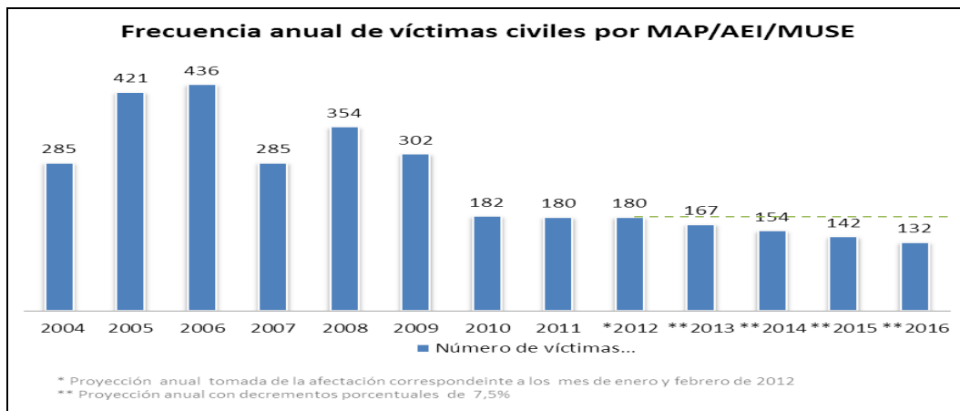
Gráfica No. 1

resultado de los Estudios de Liberación de Tierras realizados en los departamentos priorizados. Para el 2014, se espera que el 60% de las víctimas civiles han sido caracterizadas, el 70% de las víctimas civiles ya estuvieran ubicadas como lo muestra la Gráfica No. 2. Para el 2016, los 50 municipios priorizados cuentan con planes de acción integral contra minas antipersonal y el 20% debe estar en proceso de implementación (Gráfica No. 3). Así mismo, para el año 2016 50 comunidades priorizadas están capacitadas en primer respondiente.