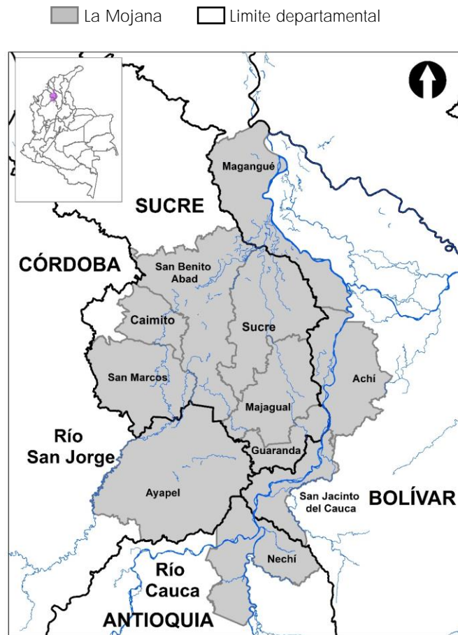
Mapa 1. Ubicación de los municipios en la región de La Mojana