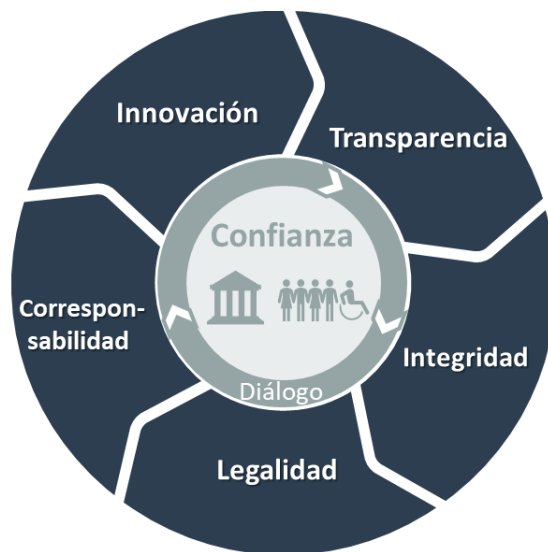
Figura 1. Elementos del Estado Abierto

virtud de lo anterior, a continuación, se presentan las principales consideraciones para el entendimiento de cada elemento del modelo de Estado abierto.