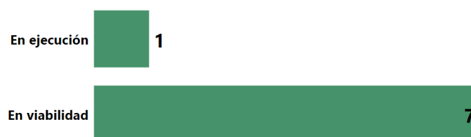
Ilustración 3. Pacto Casanare, Estado de proyectos del PAA

Dentro del proceso de seguimiento y gestión realizado por la CNIC, al cierre de la vigencia 2022, 1 proyecto se encuentra en ejecución y 7 en viabilidad.