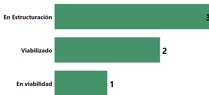
Ilustración 3. Pacto Río Bogotá, Estado de proyectos del PAA

Dentro del proceso de seguimiento y gestión realizado por la CNIC, al cierre de la vigencia I-2022, se encuentra 3 proyecto se encuentra en estructuración, 2 proyectos se encuentran viabilizados y 1 en viabilidad de acuerdo con la siguiente ilustración.