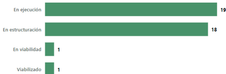
Ilustración 3. Pacto Funcional Santander, Estado de proyectos del PAA