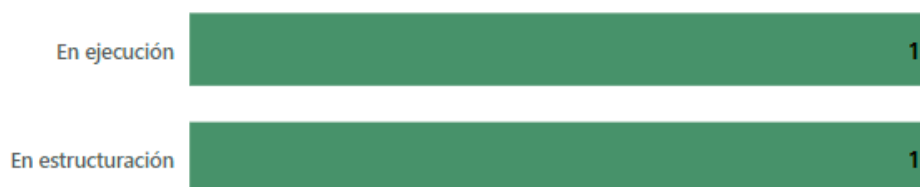
Ilustración 3. Pacto Funcional por el arte, la cultura y la vida, Estado de proyectos del PAA

El proyecto que representa un reto es el Centro Administrativo Municipal, lo anterior debido a que actualmente no cuenta con financiación y tanto el Área Metropolitana del Valle de Aburrá como el Ministerio de cultura se han mostrado reticentes a apoyar su financiación por ser una estructura netamente administrativa, por ende, presentan un avance financiero durante la vigencia de un 0%.