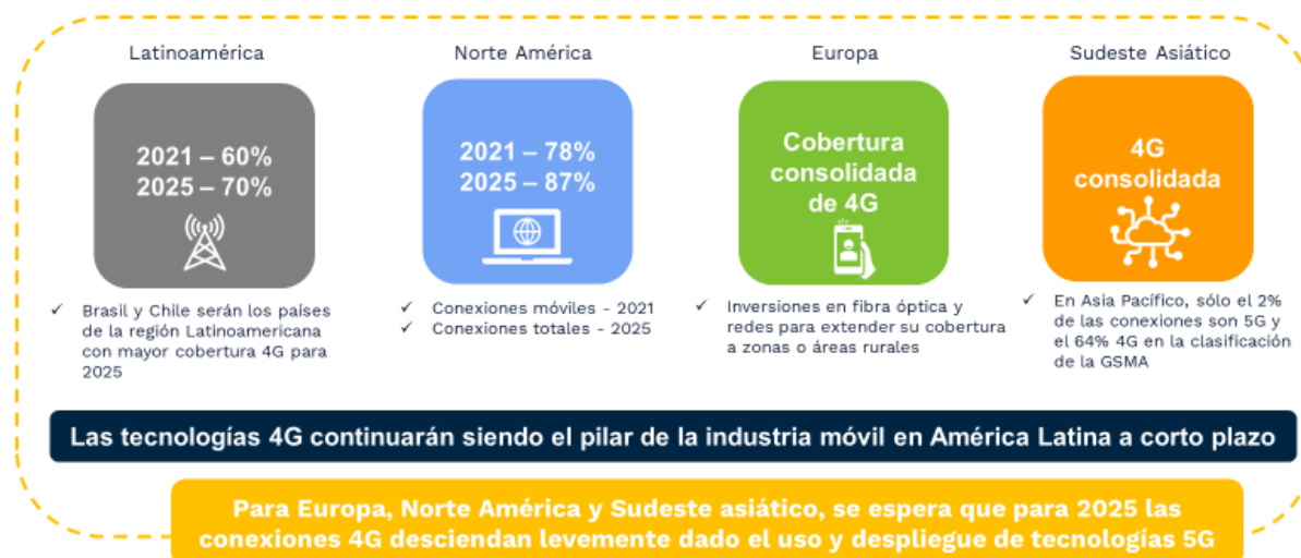
Figura 1 Elementos y porcentaje (%) de cobertura respecto a la migración de 4G