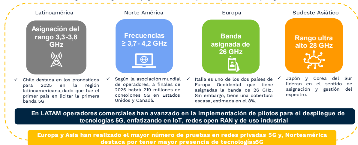
Figura 2 Asignación y gestión del espectro para el despliegue de 5G

Así mismo, en la siguiente figura se encuentran algunos elementos relevantes respecto a la adopción de 5G en otros países: