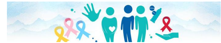
Observatorio de Violencias de Género

Abordaje integral de las violencias de género: acciones de promoción, prevención, atención integral y restitución de los derechos a las víctimas de violencias de género.