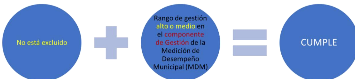
Ilustración 1. Cumplimiento criterios generales para los municipios