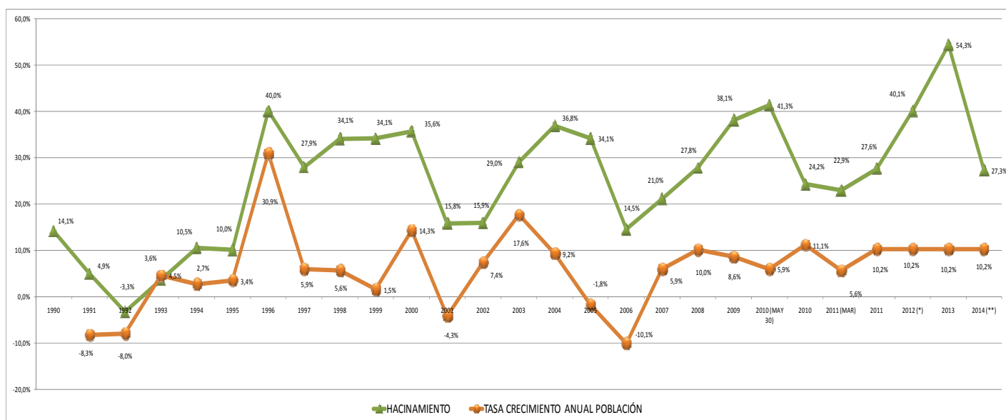
Gráfico No. 3 Hacinamiento y tasa de crecimiento anual de la población reclusa en Colombia durante los años 1990 a 2010 y proyección 2011 a 2014.

Fuente: Población reclusa y capacidad INPEC (Marzo de 2011), proyecciones de población reclusa DNP-DJSG.