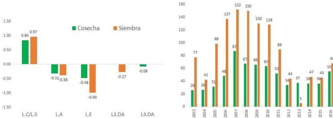
Gráfica 2 Coeficientes de las variables explicativas de los cambios en las áreas de la coca (ha)

L=rezago de un año y sucesivamente, A=aspersión, E=erradicación manual, DA=desarrollo alternativo