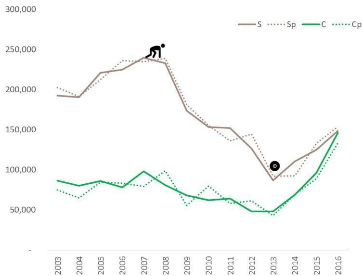
Gráfica 3 Proyección de las has de coca para el período 2003-2016

Estos modelos tienen la capacidad de replicar la interacción entre los cultivos de coca y a las políticas públicas. Es decir, la tensión entre la inercia del crecimiento rezagado de la coca y la respuesta del Gobierno. La primera habría prevalecido al principio y terminando el período. El componente inercial ha sido mitigado de manera parcial y transitoria por los diferentes instrumentos, estando pendiente de intervenir sus determinantes estructurales (Gráfica 3).