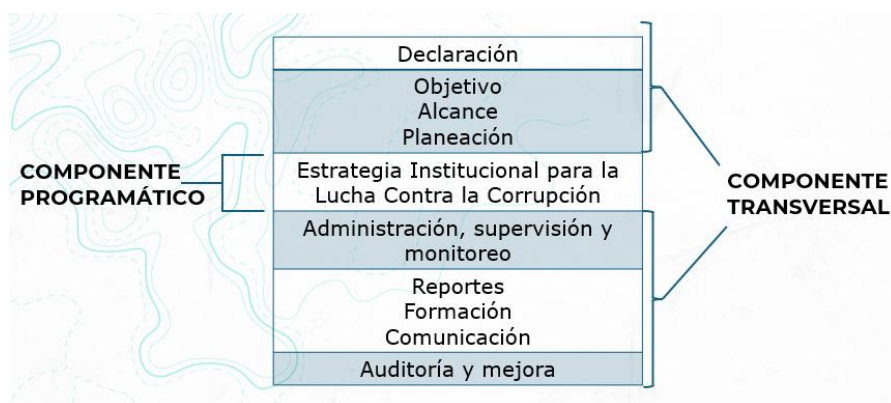
Ilustración 1. Estructura y metodología del PTEP

En síntesis, mientras el componente transversal asegura las condiciones institucionales, metodológicas y culturales para que el PTEP funcione de manera sostenida, el componente programático concentra la acción concreta, permitiendo evidenciar resultados, avances y mejoras específicas en materia de transparencia, ética pública e integridad.