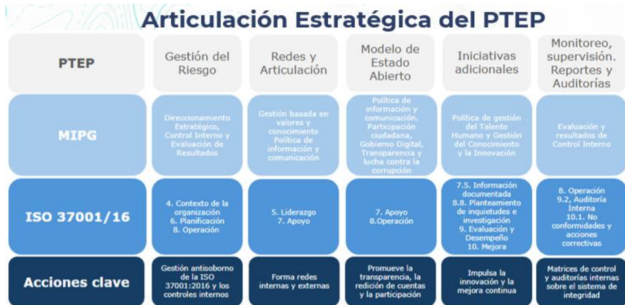
Ilustración 2. Articulación Estratégica del PTEP