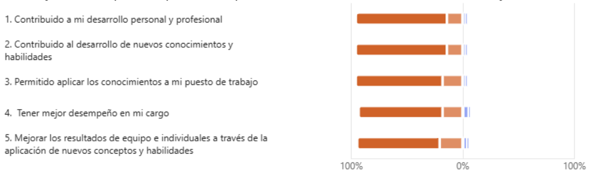
Gráfico 3 – Aspectos que han impactado en el desarrollo humano de los funcionarios

Informe evaluación de impacto capacitación 2024 DNP