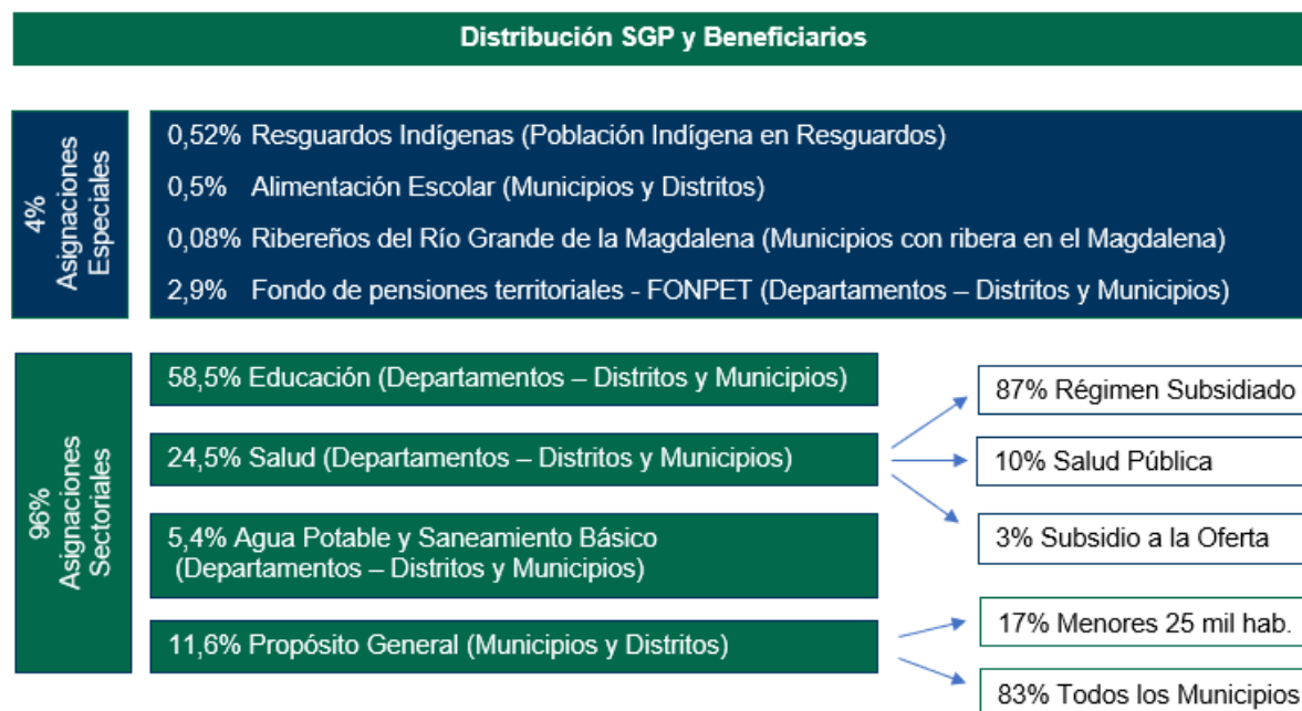
Gráfico 1. Componentes del SGP