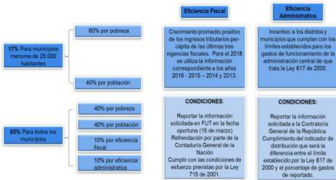
Gráfico 3. Criterio de distribución de los recursos de la participación para propósito general