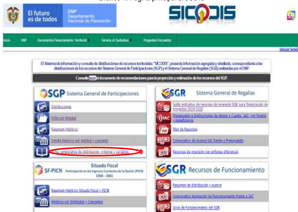
Gráfico 4. Página principal SICODIS

Esta información se puede consultar en el Sistema de Información y Consulta de Distribuciones (SICODIS), en la ficha comparativa de distribución, criterios y variables 7 . A continuación, se muestra la página principal de SICODIS y se señala la ubicación de dicha ficha: