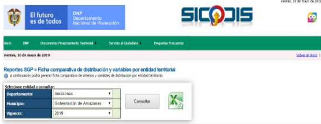
Gráfico 5. Ficha SGP por entidad