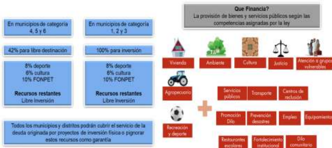
Gráfico 2. Destinación de los recursos de la participación para propósito general