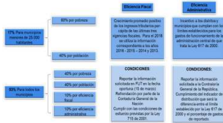
Gráfico 3. Criterio de distribución de los recursos de la participación para Propósito General