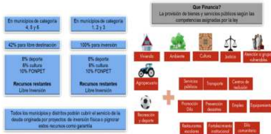
Gráfico 2. Destinación de los recursos de la participación para propósito general