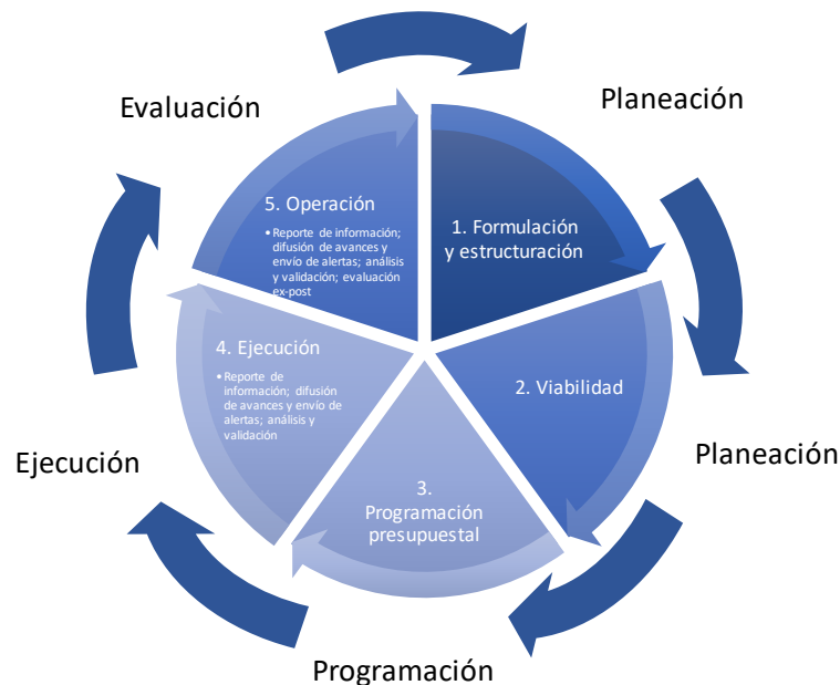
Ilustración 1 Fases y etapas de un proyecto de inversión