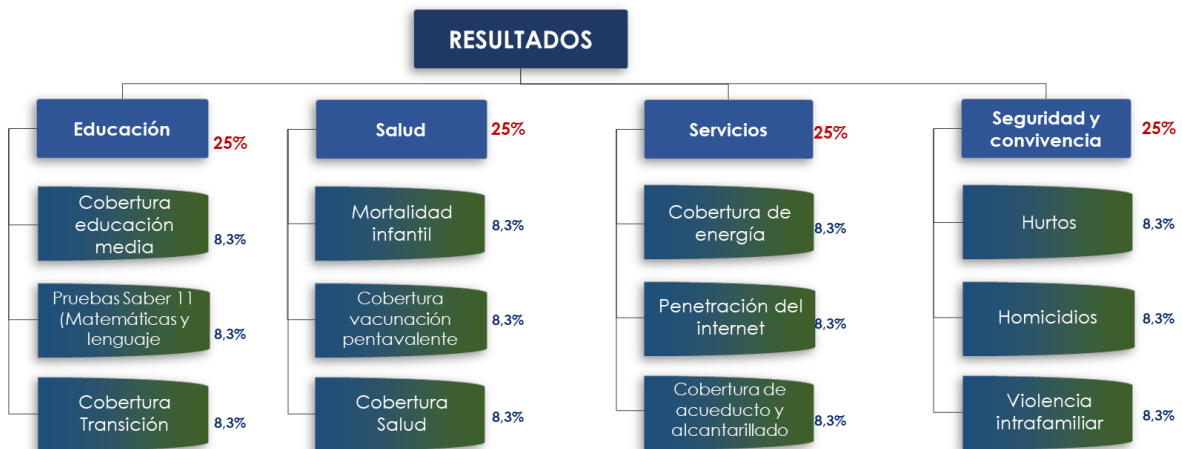
Gráfica 2. Estructura del Componente de Resultados MDM

Las variables, así como sus ponderaciones en cada subcomponente, se presentan a continuación: