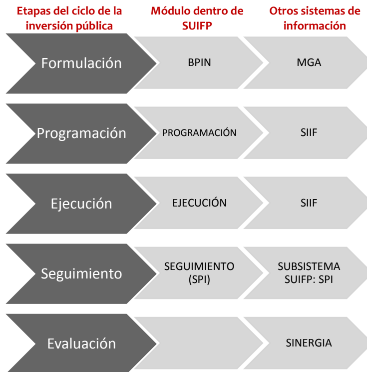
Diagrama 2. Relación entre el ciclo de la inversión pública y sistemas de información

El SUIFP es un sistema de información del DNP que integra los procesos asociados a cada una de las fases del ciclo de la inversión pública, y está articulado con otras herramientas que participan en ese ejercicio. De esta forma el DNP acompaña la identificación de los proyectos de inversión desde su formulación hasta su implementación, articulándolos con los programas de Gobierno y las políticas públicas.