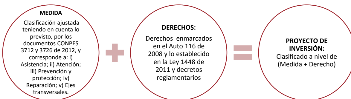
Diagrama 2. Componentes de la nueva clasificación de los proyectos en la política de víctimas del conflicto armado interno y población desplazada por la violencia

A continuación se ilustran cada una de las medidas y derechos establecidos: