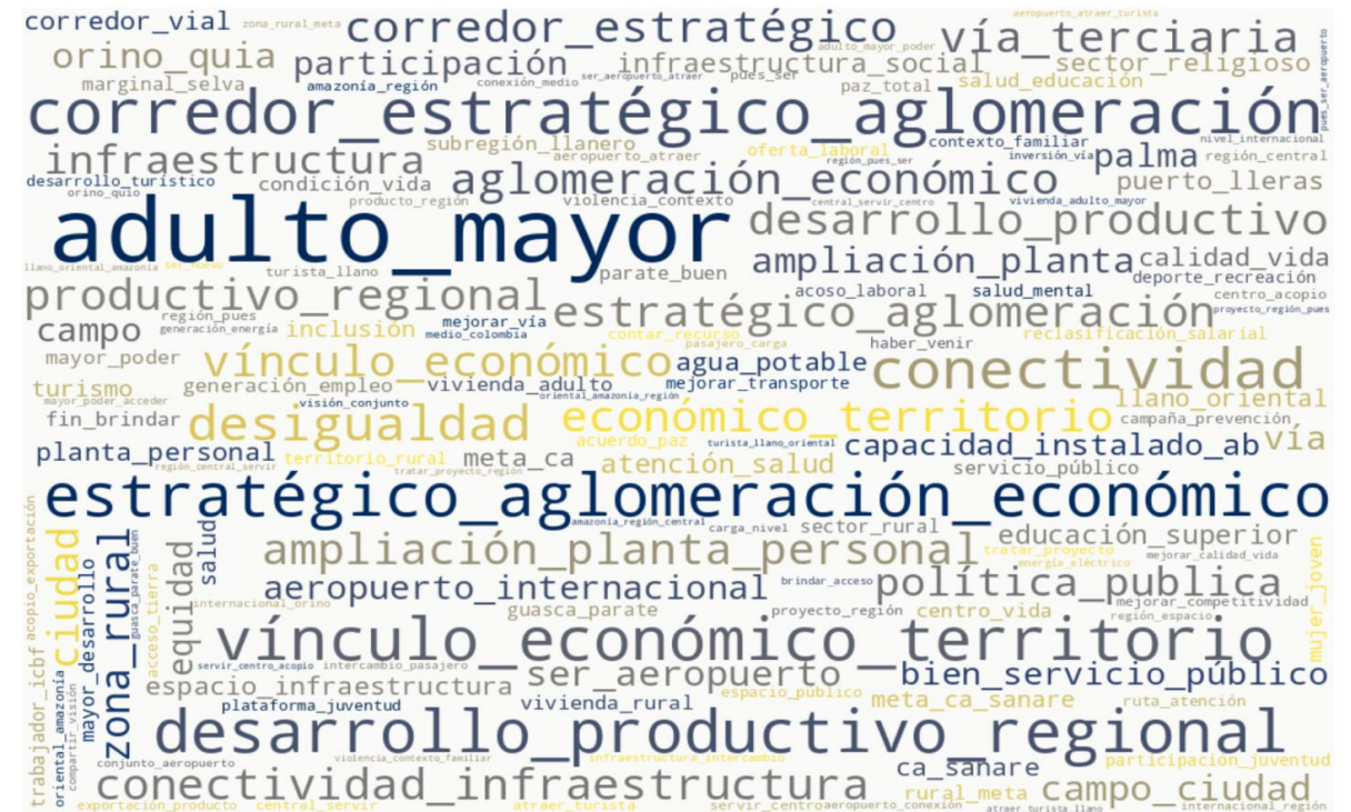
Necesidades expuestas por la ciudadanía en el Diálogo Regional para esta transformación

Fortalecimiento a la gobernabilidad territorial para la seguridad, convivencia ciudadana, paz y postconflicto