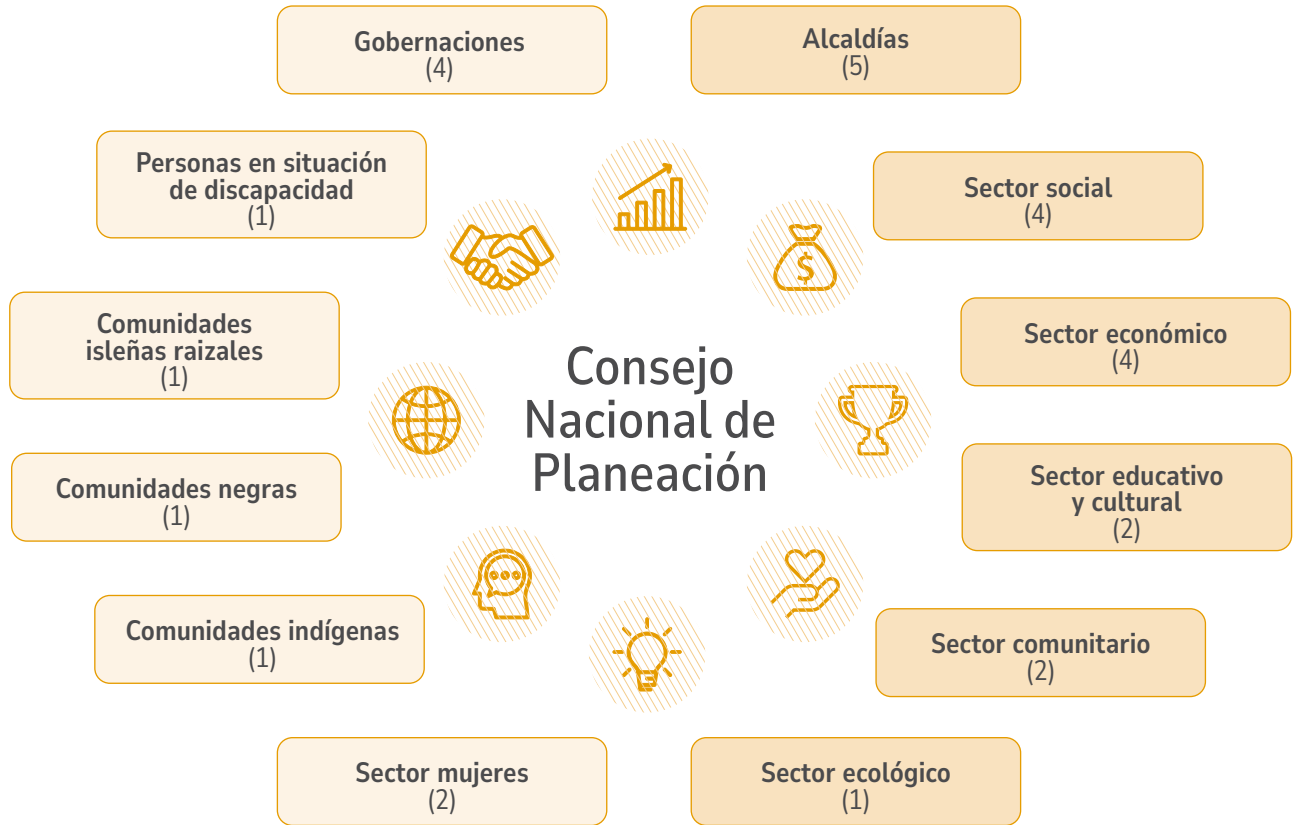
Figura 2-2. Sectores que conforman el Consejo Nacional de Planeación