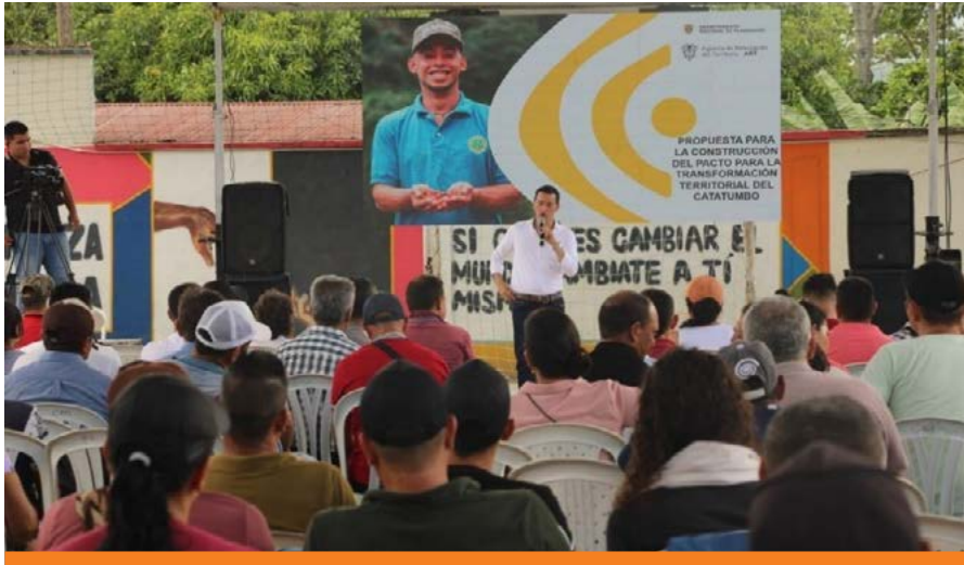
Evento 2 y 3 de septiembre de 2023. Pacto Social para la Transformación Territorial del Catatumbo. El Tarra, Norte de Santander.

Así, el Pacto Social por la Transformación Territorial del Catatumbo liderado por el Departamento Nacional de Planeación (DNP) y la Agencia de Renovación del Territorio (ART), propone una alternativa en la planeación con las comunidades, promueve un enfoque de desarrollo endógeno al reconocer el contexto, las potencialidades y las visiones de los actores sociales; así como, los efectos del desarrollo extractivista y del conflicto armado en la región. Este reconocimiento pasa por entender y concretar las demandas históricas de los procesos y organizaciones sociales y del pueblo Barí, los compromisos incumplidos y las propuestas