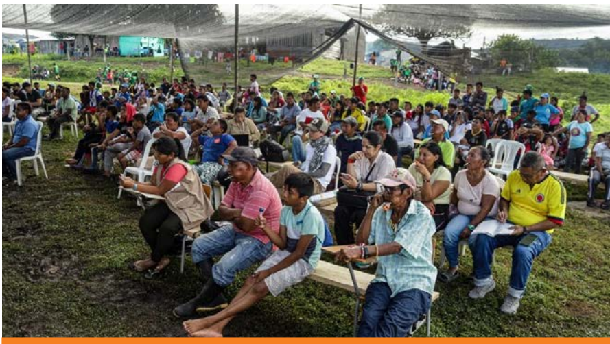
Junio de 2024: Pueblo Barí. Comunidad de Chubacbarina. Teorama, Norte de Santander.

Del mismo modo, el Pacto Social contempla que los procesos de desarrollo requieren la construcción de acuerdos sociales entre las comunidades con los Gobiernos locales, departamental y nacional, al igual que avanzar en los acuerdos entre el pueblo indígena Barí y las comunidades campesinas sobre las diferentes formas de ordenamiento, de comprensión del territorio y en la construcción de objetivos comunes.