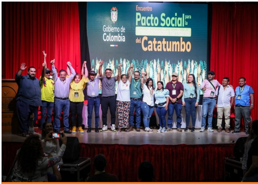
Encuentro Pacto social para la transformación territorial del Catatumbo, 4, 5 y 6 de julio Ocaña (Norte de Santander).

2026: Colombia, Potencia Mundial de la Vida y de las directrices del presidente de la República, Gustavo Petro. Este pacto representa la apuesta estratégica del gobierno del Cambio para transformar una región que ha sido víctima del conflicto, la guerra, la violencia y la exclusión, pero que se organiza para construir un futuro mejor, aprovechando sus sólidas bases sociales para proteger y fortalecer un territorio con grandes potencialidades, en el marco de la construcción de la paz.