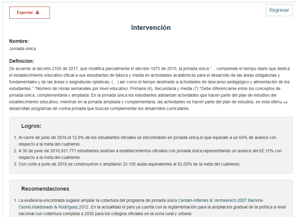
Ilustración 4. Ficha técnica y recomendaciones y logros por intervención

Así mismo, al seleccionar una de las intervenciones se obtiene la definición, los logros y las recomendaciones de política extraídas del MBE.