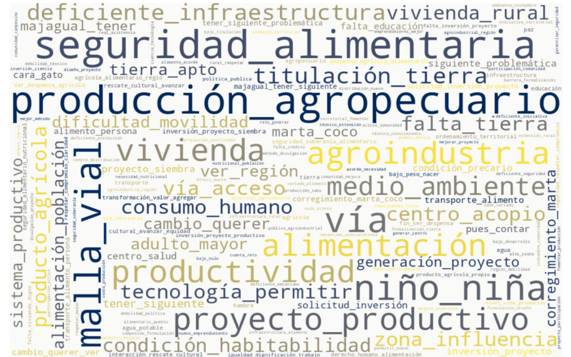
Necesidades expuestas por la ciudadanía en el Diálogo Regional para esta transformación